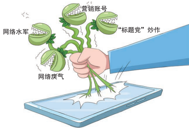
图 30.3 “清朗”系列专项行动

“清朗”系列专项行动是指中央网信办会同相关部门部署开展的专项行动，旨在集中力量整治各种网络违法违规问题，有效遏制网络乱象滋生蔓延（图30.3）。