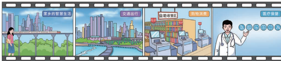
图 26.2 视频样例